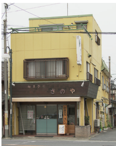
●和菓子処さのや店舗外観。

さのやには館林の魅力をネーミングにしたお菓子があります。「花沼(かしよ)」館林の新たな農産物として栽培・生産されているボイセンベリーをつかったルビー色の羊羹です。ボイセンベリーは葉酸や亜鉛など栄養豊富で美容や健康にとっても良い果物。そんなボイセンベリーをたっぷりつけた羊羹なんて嬉しいですね。お味は甘みと酸味が絶妙で爽やかな羊羹。とっても美味しいです!館林さんほの際は、是非さのやに立ち寄って、優しい店主のご夫婦と笑顔になれるたくさんのお菓子たちに出会ってくださいね。