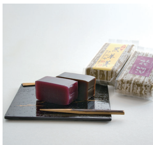
●根強い人気の「黒羊羹」とボイセンベリーをつかったルビー色の羊羹「花沼」。