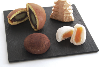
●栗どら焼き(左奥)、館林城もなか(右奥)、黒つつじ(左前)、あんず大福(右前)。

に合わないかもしれないですが、大量生産をしてどこかに卸すのではなく、町を歩いて、こんなところに小さなお店があるな、入ってみようかな」と興味を持っていただけるようなお店でありたいんです。館林はとってもいいところですね。冬には白鳥が空を飛ぶ姿が見られるのだぞ。